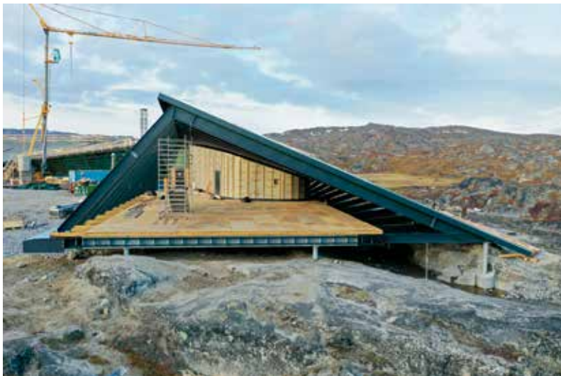
Isfjordscentret under opførelse.

Træet tilføjer et varmt udtryk til den massive stålkonstruktion og peger samtidig ud på den natur, som omkranser centret.