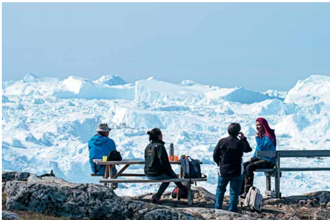
Kaffepause med udsigt over isfjorden.