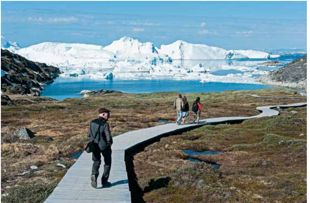
På vej mod isfjorden.