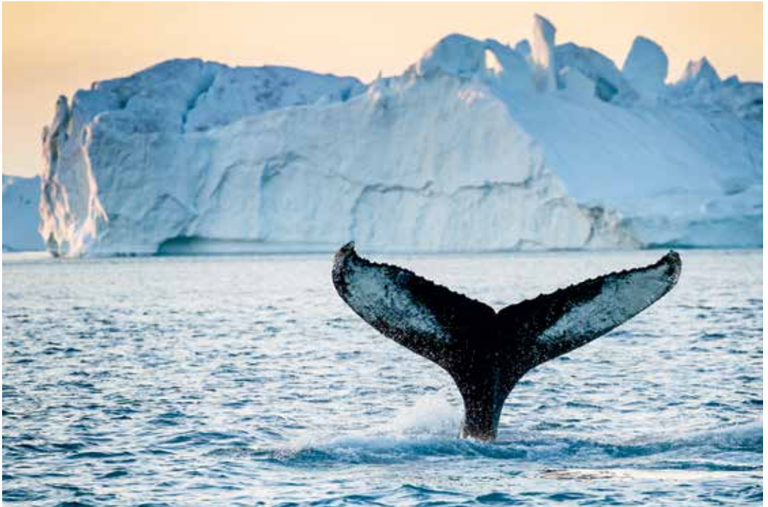
Pukkelhval, der dykker.