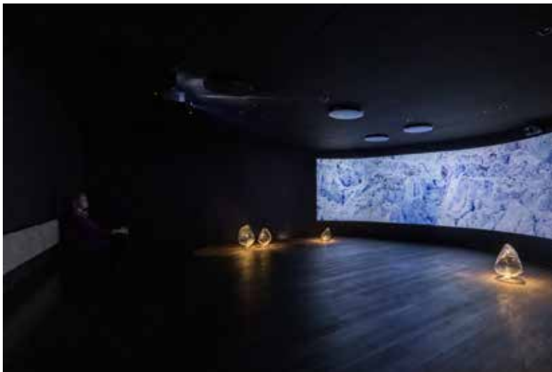
Isfjordscentret rummer også en biograf.

Udover at tilbyde sine besøgende en smuk og lærerig oplevelse vil Kangiata Illorsua - Ilulissat Isfjordscenter med tiden også rumme en både fysisk og online læringsplatform for skoler og skolebørn i hele verden. Den skal bidrage til at udbrede udstillingens omfattende indhold om is, klima, natur og inuitkultur til folkeskoleelever i Grønland og resten af verden. Gennem læringsplatformen vil undervisere frit kunne benytte centrets undervisningsmateriale, enten som en del af et besøg eller som et undervisningsforløb hjemme på skolerne. Målet er at skabe engagement blandt de unge og give dem indsigt i klimaforandringerne og i det unikke område, der ikke uden grund er optaget på UNESCO's Verdensarvsliste.