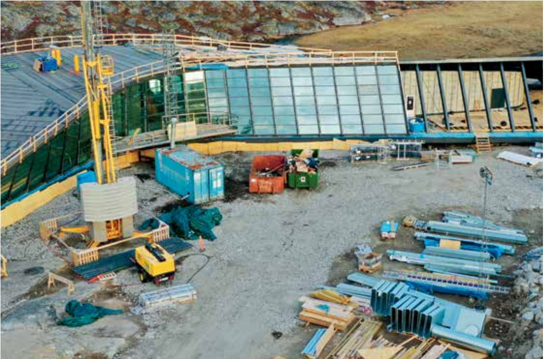
300 vinduer i forskellige størrelse er monteret i bygningen.