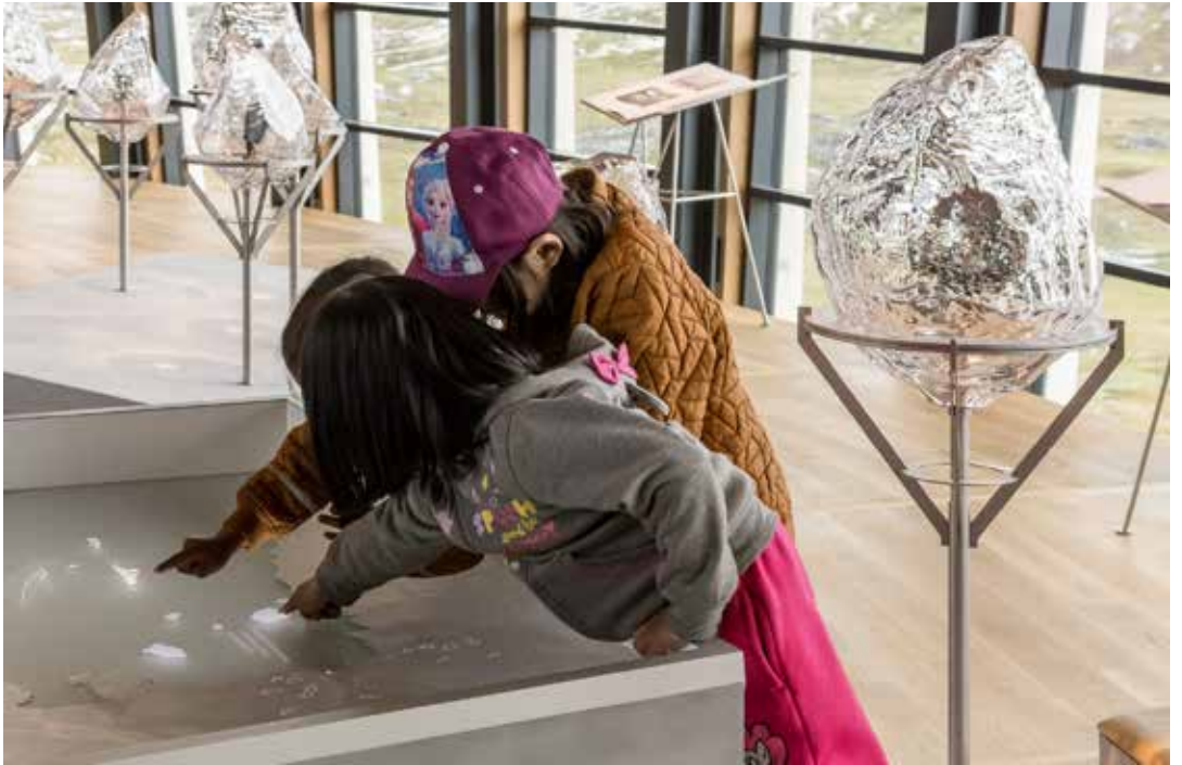
Børn lærer om livet på de tidligste bopladser i Sermermiut dalen.