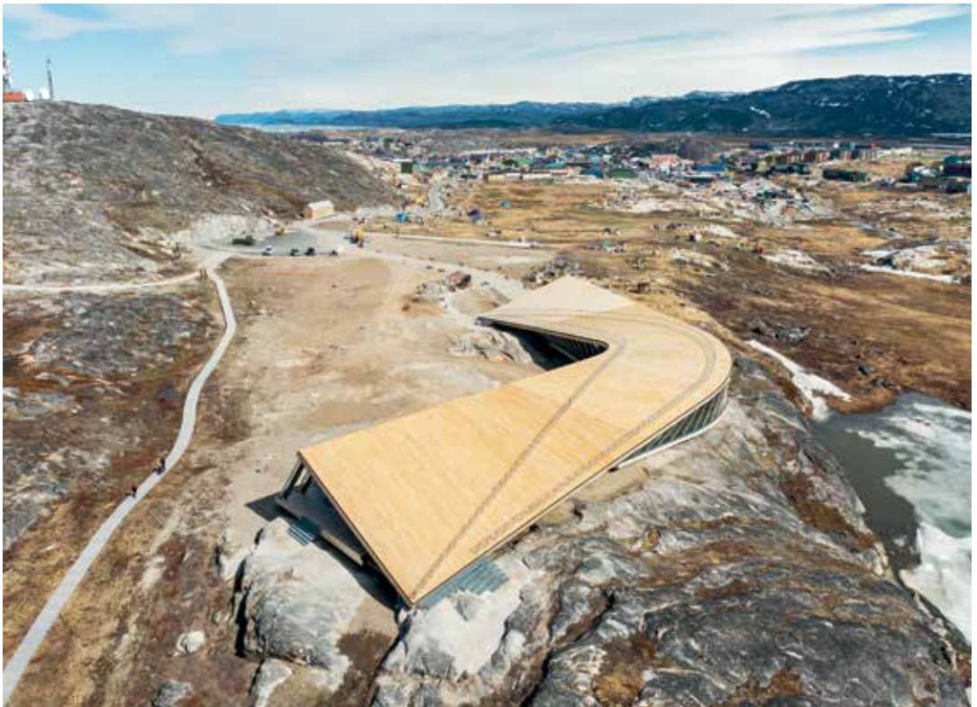
Isfjordscentret set fra en flyvende sneugles perspektiv.