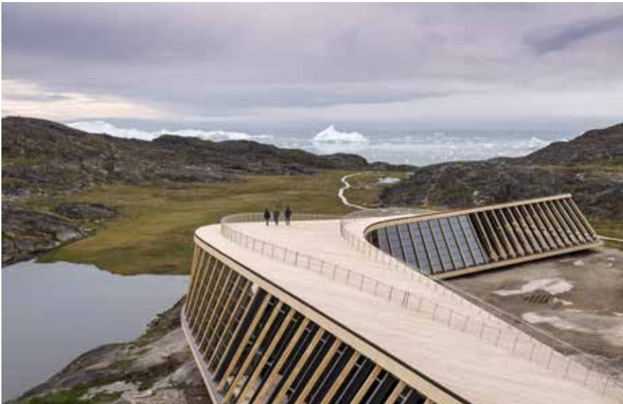
Besøgende kan tage turen henover bygningens tag og videre ud i naturen langs vandreruterne.

Isfjordscentret er tænkt som et mødested. Det kommer også til udtryk i arkitekturen. Med sin vredne konstruktion skaber bygningen et overdække i hver ende, så besøgende kan stå i ly for vejret. Den fri adgang til taget i løbet af sommer, forår og efterår gør det muligt for lokale og andre besøgende at benytte centret, når de har lyst, og skaber et naturligt samlingspunkt, hvor man kan opleve den imponerende panoramaudsigt over isfjorden og de enorme isbjerge, der elegant flyder forbi.