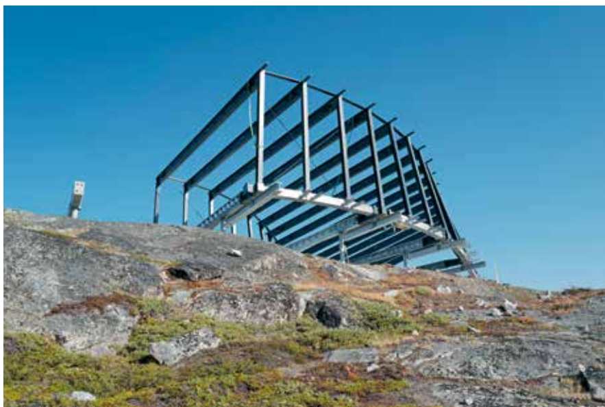
Isfjordscentrets skelet af stålrammer.

hurtigt og intenst i de lyse måneder, inden frostgrader og dybt mørke sætter ind og gør det noget nær umuligt at bygge udenfor. Realdanias datterselskab Realdania By & Byg var som bygherre ansvarlig for byggeprocessen og blev understøttet af et stærkt hold af erfarne arkitekter, ingeniører samt lokale entreprenører og håndværkere, som kender området særdeles godt. Og netop det lokale kendskab og viden om at bygge i det barske klima er fuldstændigt afgørende for, at Kangiata Illorsua – Ilulissat Isfjordscenter kunne slå dørene op til tiden.