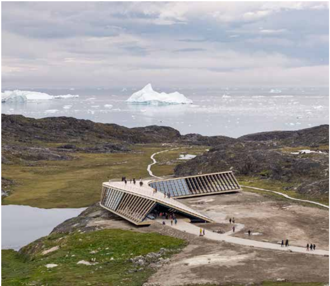
Der er fri adgang til Isfjordscentrets tag, hvorfra man kan nyde udsigten over fjelde og fjord.