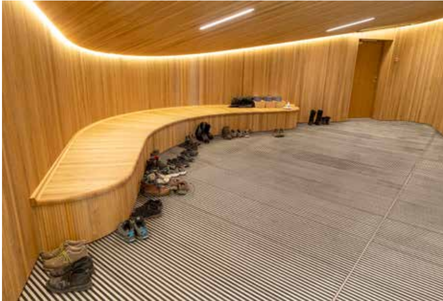
Isfjordscentrets indvendige vægge er beklædt med specialudformede lister i træ.

Opførelsen af isfjordscentret er en anledning til fortsat at sætte fokus på klimaforandringerne og den betydning, som udviklingen i Arktis har for resten af kloden. Den øgede afsmeltning af Grønlands indlandsis som følge af klimaforandringer udgør omkring en tredjedel af de samlede årsager til den globale havvandstigning.