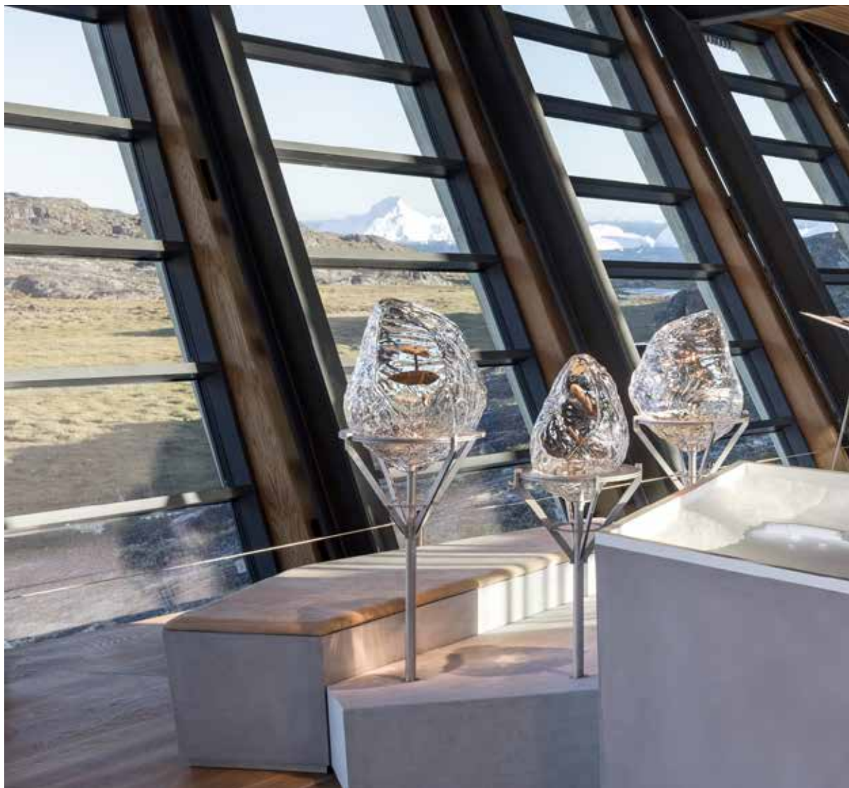
Udstillingen består af et landskab af isflager, hvor arkæologiske genstande og film udstilles i mundblæste isprismer af glas.