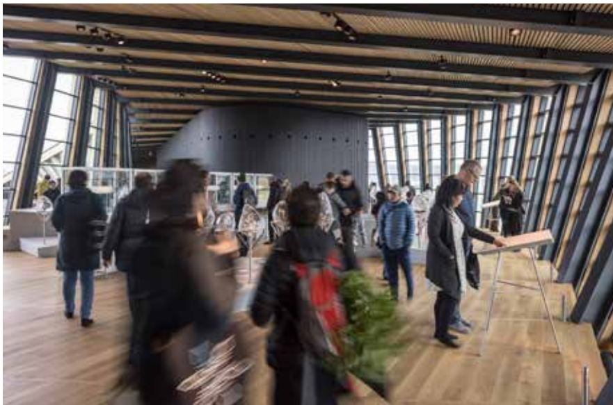
Besøgende oplever udstillingen "Sermeq pillugu Oqaluttuaq – Fortællingen om is."