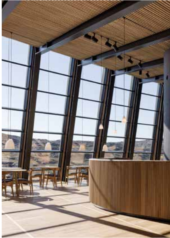
Fra receptionen og café-området er der direkte udkig til landskabet.