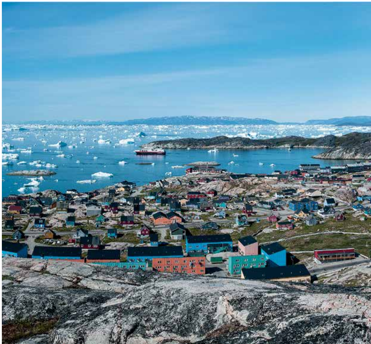
Vue over Ilulissat by og isfjorden.