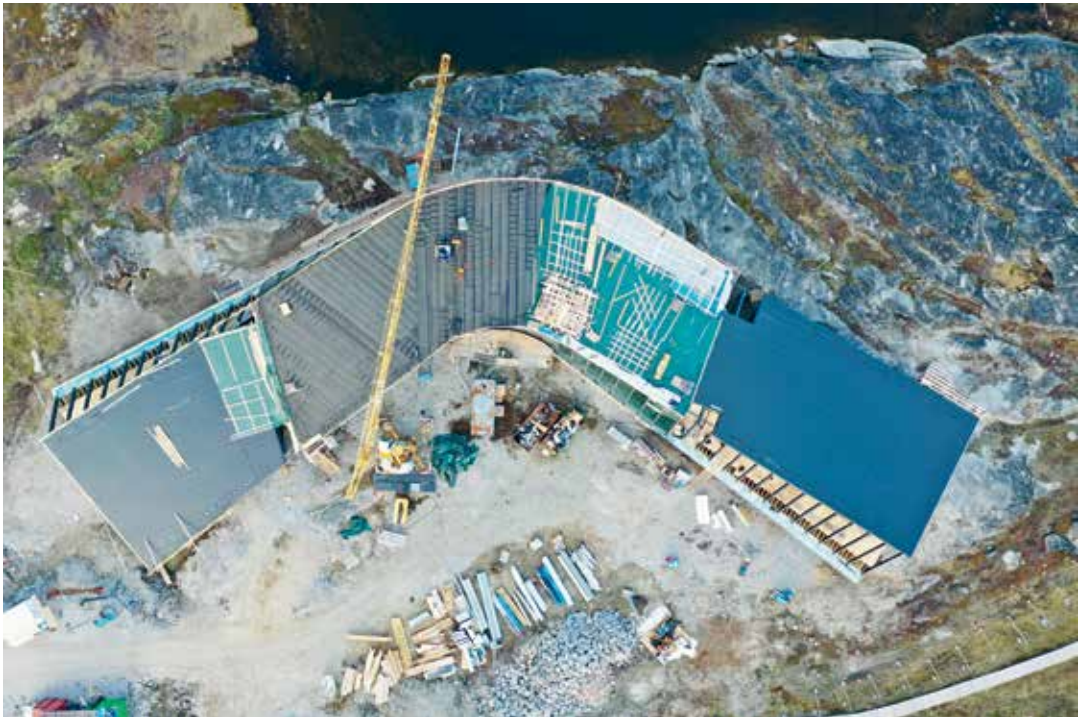
Isfjordscentrets vredeede bygningsstruktur, der ligger som en boomerang set oppefra.