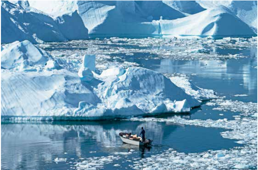
Jollefiskeri i fjorden.

Fiskeri og fiskeindustri er stadig et af de vigtigste erhverv i Ilulissat, og livet omkring havnen summer af aktivitet. Tidligere var det især fangsten af store havpattedyr, som sæler og hvaler, der gav mad på bordet og penge i pungen. Dengang var livet centreret om at skabe de gunstigste forhold for fangst, for eksempel gennem særlige ritualer. I dag er fangsten hellefisk og rejer, men selvom byttet er nyt, er mange af de gamle fiskeri- og fangstmetoder bevaret og videreudviklet.