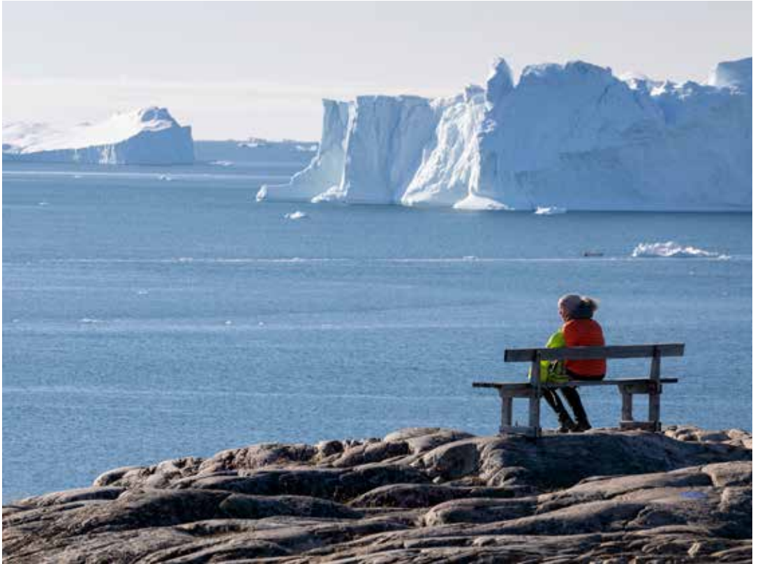
Den ultimative udsigtsbæk.