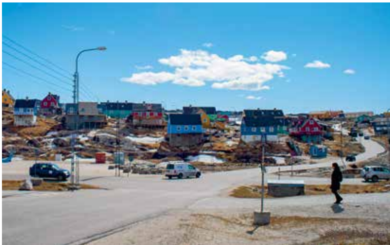
Dagligliv i Ilulissat by.

For at imødekomme de mange nye besøgende er der et ønske om at styrke kvaliteten af de oplevelser, som Grønland kan tilbyde turister. Derfor vil Grønlands Selvstyre over de kommende år etablere i alt seks besøgscentre, hvoraf Realdania har understøttet etableringen af det første, nemlig Kangiata Illorsua – Ilulissat Isfjordscenter. Foruden en styrkelse af fortællingen om Grønland skal isfjordscentret og de fremtidige besøgscentre også bidrage til en positiv udvikling af den grønlandske økonomi, som i sidste ende skal sikre flere arbejdspladser og øget vækst i det grønlandske samfund.