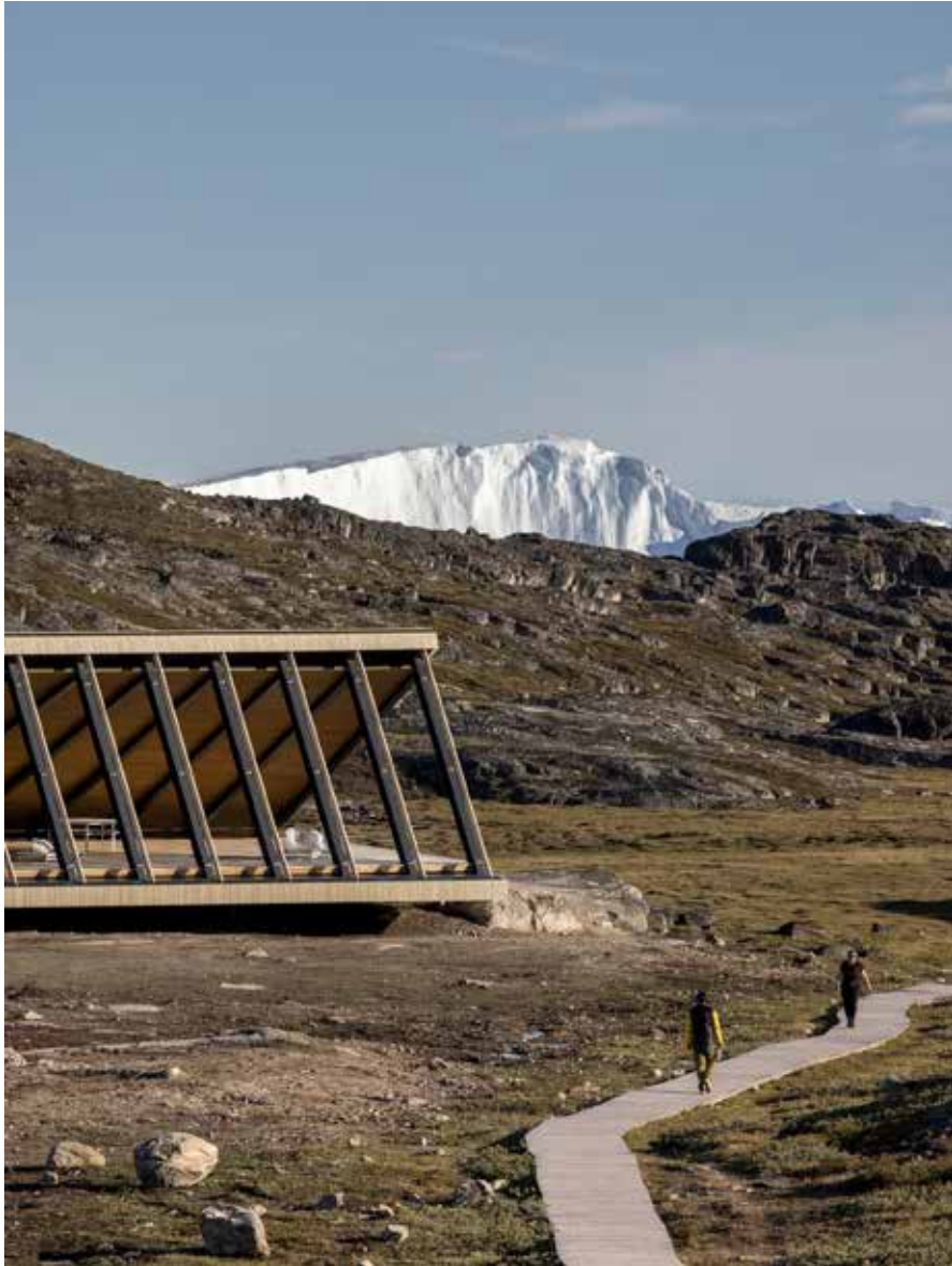
Isfjordscentret ligger som et knudepunkt for områdets vandreruter.