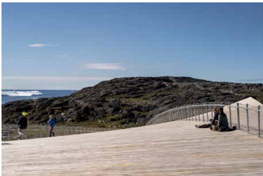
Den vrede bygningskonstruktion giver mulighed for nye perspektiver for den besøgende.

Isfjordscentret ligger som et knudepunkt for områdets vandrerruter og forbinder Ilulissat med den åbne isfjord. Når besøgende ankommer til centret fra Ilulissat by, bliver de mødt af den træbeklædte bygning omkranset af fjelde. Herfra kan de bevæge sig ind på den overdækkede ankomstterrasse og videre ind i selve centret eller tage turen op over taget.