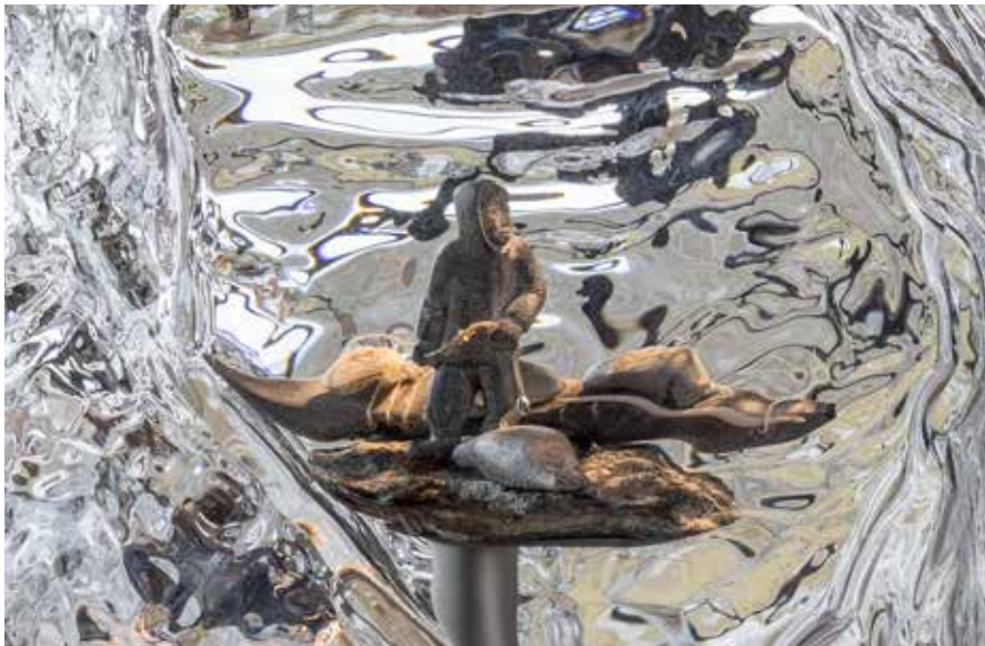
Isprisme af mundblæst glas.

Ilulissat og området omkring isfjorden har på grund af sine helt særlige kvaliteter været bosted for en række kolonier gennem historien. Der peges tilbage i tid, når besøgende bliver klogere på, hvordan isfjorden var med til at skabe den over 4.000 år gamle boplads Sermermiut. Men der trækkes også nutidige paralleller til, hvordan Ilulissat-beboerne på innovativ vis tilpasser sig isen i en tid med klimaforandringer. Alt sammen krydret med personlige fortællinger og beretninger fra lokale borgere.