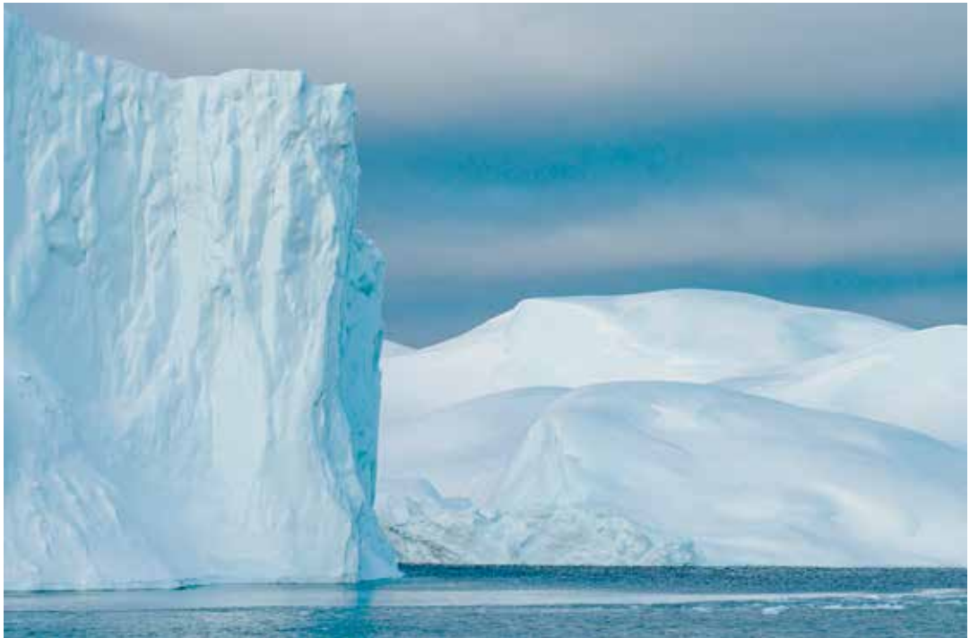
De massive isfelde i fjorden.