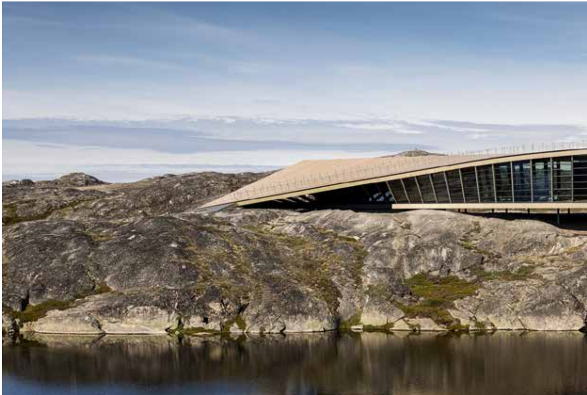
Bygningens form er inspireret af en sneugles flugt hen over landskabet.