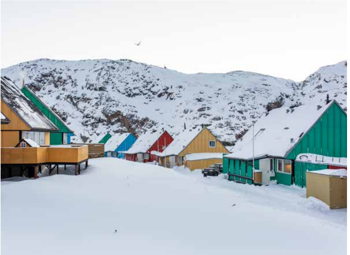
De små træhuse i stærke farver er ikoniske for den grønlandske byggestil.