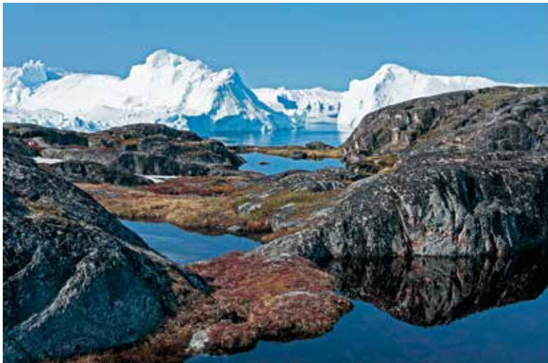
Det UNESCO-beskyttede landskab ved Ilulissat Isfjord.

Fangsten blev også central i begyndelsen af kolonitiden ved Diskobugten (Qeqertarsuup Tunua), hvor fiskerne flokkedes omkring det gunstige naturområde. Det gjaldt også de bedste fangere. De dygtigste og mest produktive fangere blev kaldt storfangere. De formåede ikke bare at brødføde familien, men byttede endda deres fangst til europæiske varer for på den måde at vise deres velstand.